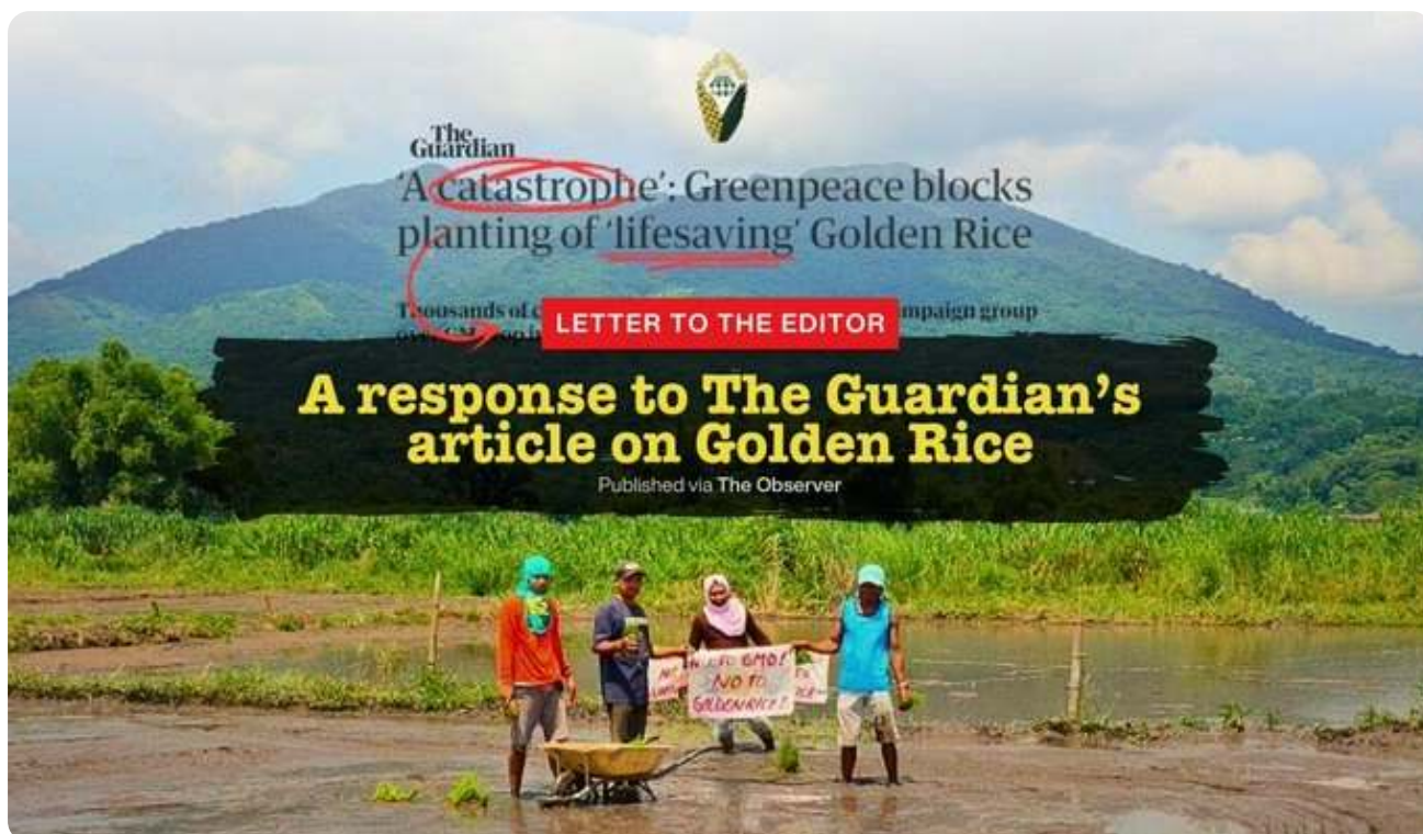
MASIPAG: 对 The Guardian 关于转基因黄金大米的文章的回应