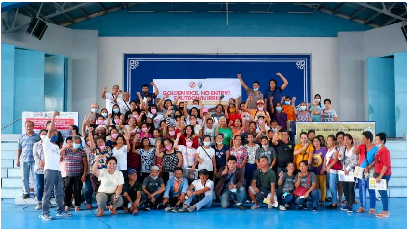
停止黄金大米！网络（SGRN）